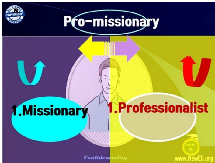
Figure 1) 전문선교사를 그림으로 표시 즉 100% 전문인, 100% 목회자라고 정의함

산전투에서 사망했다 소식을 듣고 딸 셋을 조부에게 맡겨놓고 젓먹이 자식(필자의 형)만 달랑 등에 엮고 죽은 남편의 시체를 찾겠다고 파리가 새까맣게 들어 붙은 시체하나 하나를 들쳐보며 찾아 내려온 곳이 바로 피란민들이 정착하는 바로 아버지가 계신 곳이었습니다. 결국 그 곳에서 두분의 운명적인 만남을 했던 겁니다. 전쟁의 발톱이 핏물고 지나간 대한민국은 정말 눈뜨고 볼 수 없는 상황이었다고 합니다. 특별히 피난민만 모여 사는 판자촌엔 전쟁통에 남편은 부인을, 부인은 남편을 잃은 사람들이 모여 살았고 또 전쟁으로 신체일부를 잃어버린 사람들의 모임이었으며 이른바 나머지 과반수는 동키부대에서 대원의 목숨을 잃었던 대원들의 가족들이 모여 함께 사는 공동부락이 되어 버렸습니다.