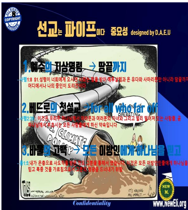
Figure 10) 선교가 교회의 주요활동이어야한다란 캐취프리즈

것이고, 영의 젓과 꿀이 흐르는 나라로 만드는 리더가 될 것입니다. 더우기 이런 일들은 이 자유세계시장 경제에 그들이 미국과 추가로 한국의 네트워크만 있어도 성공할 환경조성은 다 되어 있는 것입니다. 바라움기는 여기에 하나님과 함께 하는 그들이라면 이미 이루어진거나 진배가 없는 일입니다. 이거야 말로 “되는걸 왜 안해”입니다. 언급했듯이 이리 진화한다면, 크리스찬 엘리트들이 세상에 미치는 영향이 엄청 커짐을 시사하는 것입니다. 그런데 중차대한 시대적 흐름에 이걸 안해? 너만 그럼 너만 손해가 되는것입니다.