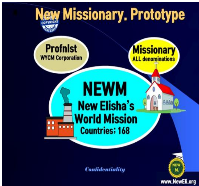
Figure 3) 새 사명자 미션, 전문선교사가 목회와 기업으로 선교함

이른 아침에 출근해서 어둑해지면 집에 들어오고, 수요일이면 수요일예배, 금요일이면 금요일예배, 일요일이면 주일예배로 늘 바빴습니다. 수십 년간 설교를 받아 적은 수십 권 대형노트가 있고, 몇 시간씩 드라이브해야 하는 귀찮음도 마다 않고 참 부지런히 교회를 다녔습니다. 회사, 집, 그리고 교회였습니다. 시간이 지나선 교회도 개척 했었습니다. 이게 나의 미국 생활입니다. 회사를 옮겨도 나의 생활은 교회 생활이 우선이었습