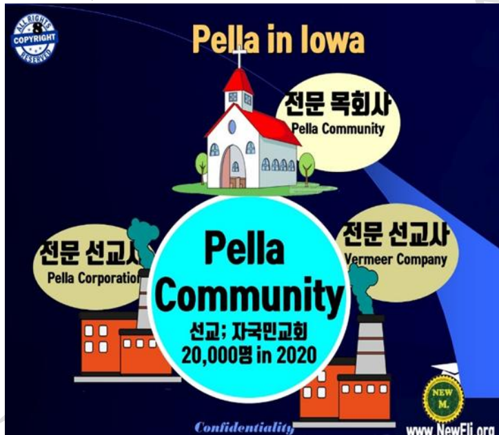
Figure 2) 펠라공동체가 2만여명의 동공체를 오하이오주에 형성했다

될거야”란 말씀도 함께 전해주시곤 하였습니다. 그들이 방문할때면 어쭙지않은 얼굴로 꼭 그들의 손엔 고기 한근을 딸랑거리며 들고 들어왔던 기억이 납니다. 몇십년이 지나가도 우린, 그 동네에 다 쓸어져가지만 더 이상 좋아질것 같지 않은 작은 판자집에서 살았습니다. 늘 부족했던 그때 융통성 없어 보였던 아버지가 서운도 했었지만 결국 아버지의 의지는 굳굳하셨으며, 고향을 잃고 타지에 온 모두가 잘 살게 하겠다는 철학은 변함이 없으셨고, 어찌든 그들의 노력이 허되지않게 아버지가 할 수 있는 피난촌의 리더로서 최선을 다 하셨습니다. 해서 저희 삼남매는 그걸 목도하며 자랐습니다. 저희 부모는 늘 저희같은 피난민들이 이렇게 라도 살겠끔 따듯하게 문을 열어준 남한 사람들에게 늘 감사할 일이라고 말씀하셨습니다. 허지만 어찌된 일인지 세월이 지난 한참 후엔 피난민들이 원래 남한 사람들보다 더 잘 살게 되어갔습니다. 그 당시에 필자가 문고에서 처음 빠져들어 본것이 수호지이란 책이였고 그책에서 공동체의 개념을 처음 배웠고, 아버지에게 몸으로 보고 배운것이 공동체의 삶이었습니다.