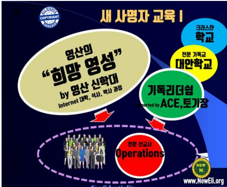
Figure 7) 영산의 절대 희망이 새사명비전에 주는 영향

하는 필자 혼자만의 질문이었던 것입니다. 왜냐하면 필자가 알고 있는 영산이 있어야 한번도 가보지 않은 길에서 일어날 이런 기적을 기대할 수 있기 때문입니다.