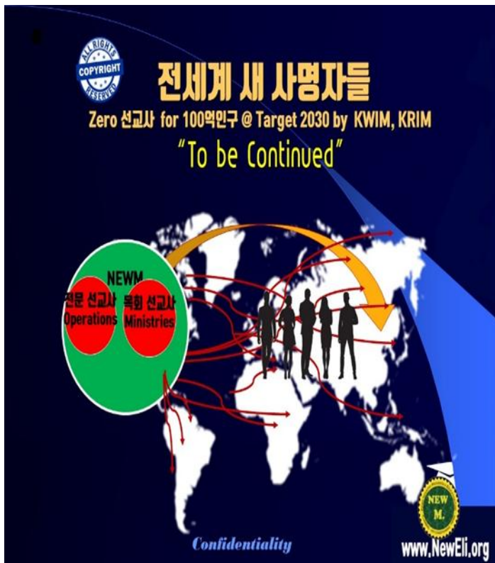
Figure 5) 전세계 새 사명자운동으로 확산되는 꿈을 표시함

세상은 세계 무역화로 서로 물건을 사고 파는 과정을 겪고 있으며, 이에 따른 경제 시스템을 일반적으로 "시장 경제"라고 합니다. "자유 시장 경제"는 공급과 수요에 따라 물가와 자원 배분이 결정되는 경제 모델을 지칭합니다. 이러한 경제 시스템은 경쟁과 효율성을 촉진하며, 소비자 선택과 생산자의 자유로운 경쟁을 통해 자원의 효율적인 할당을 추구합니다. 20세기 후반부터 21세기 초기에 이르는 기간은 글로벌 경제에서 특히 활발한 시기로 평가되고, 이 기간 동안 정보 기술의 발전과 글로벌화로 인해 다양한 산업 분야에서 혁신과 성장이 이뤄졌습니다. 특히 1990년대 후반부터 2000년대 초반에는 인터넷과 디지털 기술의 급격한 발전으로 인해 전 세계적으로 물류 활동이 확대되었으며, 새로운 경제 활동이 형성되었습니다.