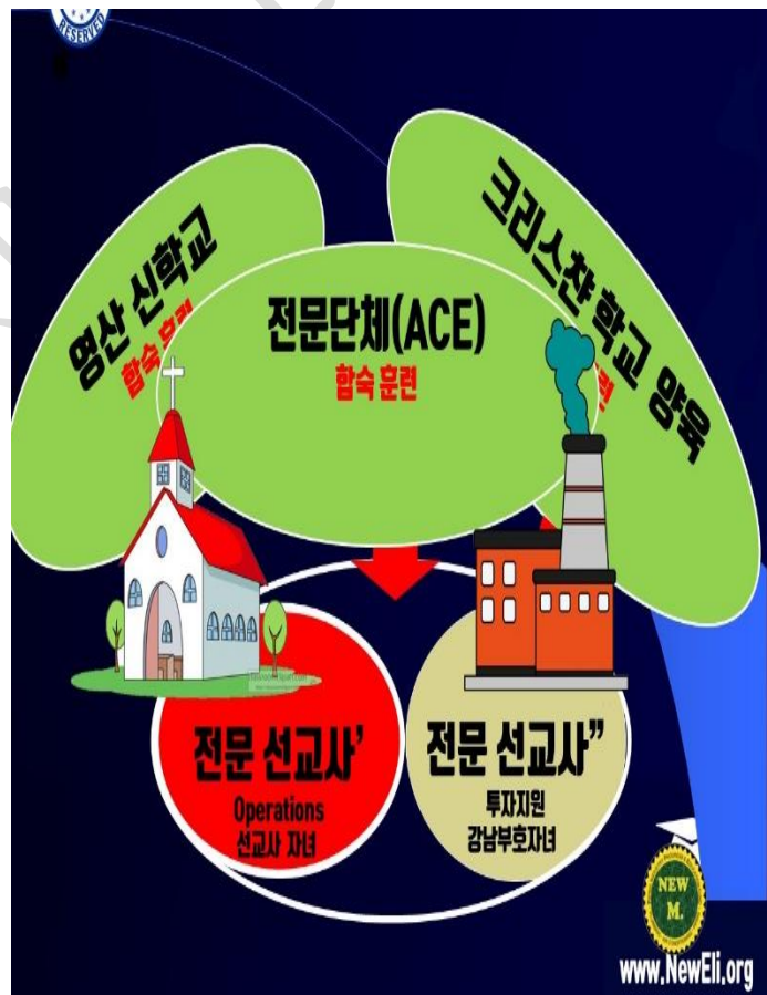
Figure 6) 전문선교사 지원 단체들을 표시함

말하자면, 구식으로 선교살 오지로 보내는 것이 아니라 했으니 그럼 어디로 보내야 한단 말인가?란 질문이 생깁니다. 어려운 질문이나 대답은 쉽습니다. 한국보다 차등한 나라의 선교지로 보내는 것이야말로 이 시대의 적절한 전략이 될 것이기 때문입니다. 한 예로 이 차등국 선교지라면 조